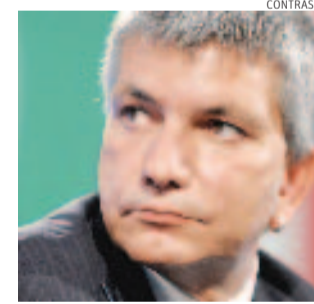
Governatore, Nichi Vendola

ROMA ■ «Basta con questa caccia al tesoro». Nichi Vendola, presidente della Regione Puglia, preannuncia scintille nell'incontro di oggi tra i Governatori e l'Esecutivo. «Non è vero che le Regioni non sono capaci di spendere i fondi europei e le risorse del Fas». Eppure Bruxelles ha concesso una proroga di sei mesi proprio per evitare di perdere soldi del 2000-2006 non spesi. Si è lasciato credere che c'erano miliardi che rischiavano di tornare a Bruxelles ma poi si è capito che c'erano quote marginali non spese per una causa precisa: aver incluso nel Patto di stabilità anche gli investimenti per la spesa comunitaria. Le Regioni del Sud, ex Obiettivo 1, per non rischiare il disimpegno delle risorse avrebbero dovuto violare il Patto. E quanto alla proroga della Ue fino al 30 giugno, faccio presente che non abbiamo