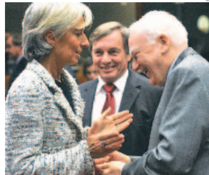
Vertice. Il ministro francese Christine Lagarde e quello del Lussemburgo Jean-Claude Juncker (al centro) con Philippe Maystadt, presidente della Bei

A sottolineare l'importanza centrale ormai assunta dalla questione che in Europa ha già incassato 300 miliardi destinati alla ricapitalizzazione e 2,4 trilioni sotto forma di garanzie sui prestiti, l'Ecofin ha approvato ieri una dichiarazione ad hoc. In essa si sottolinea l'importanza delle azioni prese dai Governi a sostegno delle banche, la necessità della «chiarezza sul ruolo del capitale negli istituti di credito, specialmente quando continua l'interruzione della fornitura di credito», il sostegno alla modifica delle regole internazionali, l'opportunità della sorveglianza sull'attuazione dei piani di salvataggio con l'invito a Bruxelles a presentare raccomandazioni per potenziarne l'efficacia.